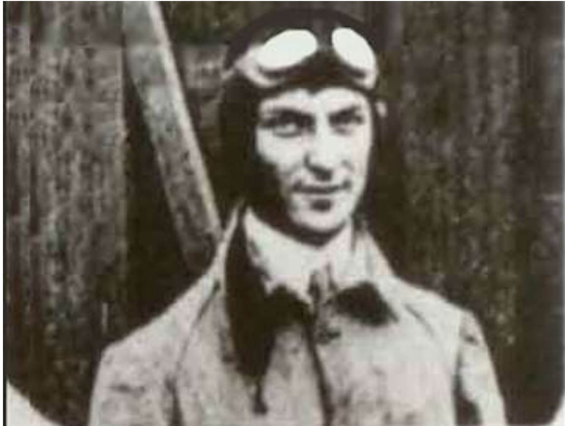
Ο Εμμανουήλ Αργυρόπουλος, ο πρώτος πολιτικός αεροπόρος στην Ελλάδα